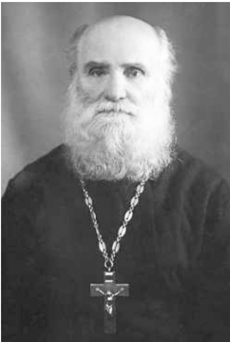
Святой праведный пресвитер Пётр Чельцов, исповедник.

...Продолжение. Начало в предыдущем номере.