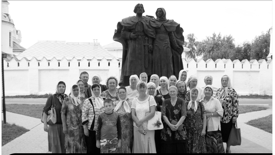
...И навестили в Муроме святых покровителей семьи Петра и Февронью