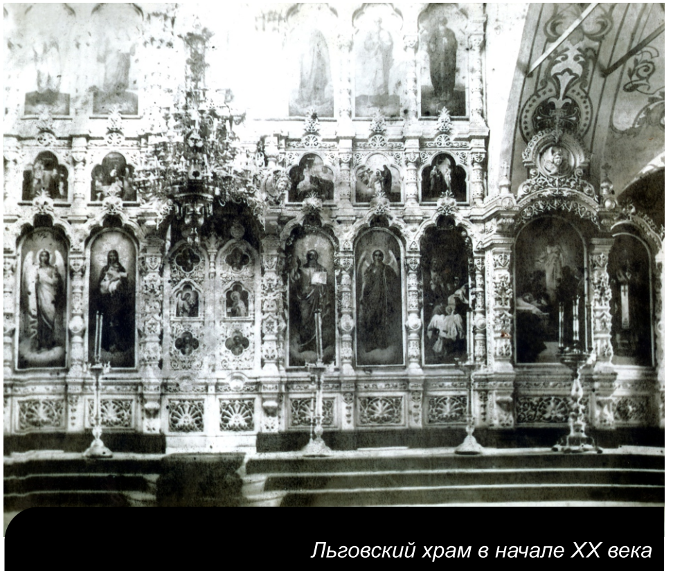
Льговский храм в начале XX века

По старинной технологии в материал для каменной кладки замешивали яйца, поэтому стены получились очень крепкие. В храме стояли несколько столов, где загодя устанавливались незажжённые лампадки. Люди, приходя в храм со своим маслом, наполняли и возжигали каждый именно свою лампадку. При этом столы, на которых стояли лампадки, подразделялись на рубцевские, лужковские и льговские. Большая прихрамовая территория была отгорожена красивой оградой. Площадь позволяла хоронить упокоившихся даже